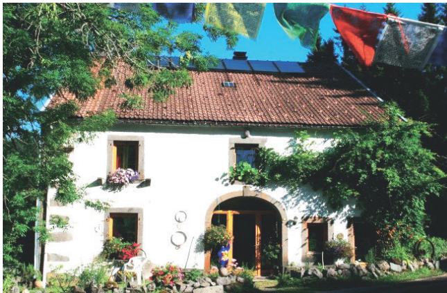
Das Seminarhaus in den Vogesen

Übungen in der Natur laden dazu ein, mit einer Frage, einem Thema oder einem Körpersymptom nach draußen zu gehen. Wir können erleben, dass die Natur Antworten auf unsere Fragen gibt. Und mit der Darmreinigung öffnen wir die Tore für eine Gesundheit auf allen Ebenen.